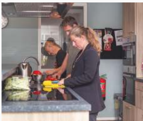
Bijdrage: € 25.000 (met 5.000 van label Sint Jan)