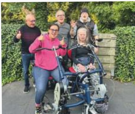
Bijdrage: totaal circa € 16.500