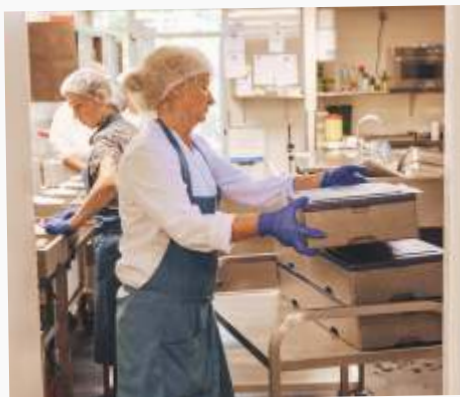
Bijdrage: € 64.000

In 2020 en 2021 hebben we daarom nog eens zo'n € 3.500 gedoneerd voor de aanschaf van nieuwe menuboxen. Tafeltje Dekje verzorgt al ruim 40 jaar warme maaltijden voor Texelaars die, om verschillende redenen, niet voor hun eigen maaltijd kunnen zorgen. Een belangrijk initiatief dat de zelfstandigheid van (vooral) ouderen vergroot.