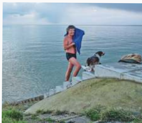
Bijdrage: € 3.700

Zo ontstond het idee voor de aanleg van een betonnen trap op deze twee locaties, zodat de zwemmers gemakkelijker in en uit het water kunnen komen. Zeker in de wintermaanden, wanneer het gras en de keien op de dijk nat en glibberig zijn, bieden de trappen een veilige toegang. Er wordt veel gebruik van gemaakt.