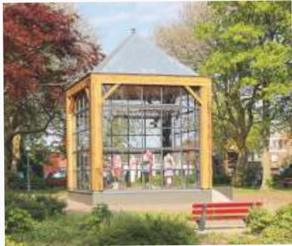
Bijdrage: € 10.000

In de afgelopen tien jaar keerden we ruim 1,57 miljoen euro uit aan 140 projecten. Hieronder een greep uit de initiatieven die Samen één Texel mede mogelijk maakte.