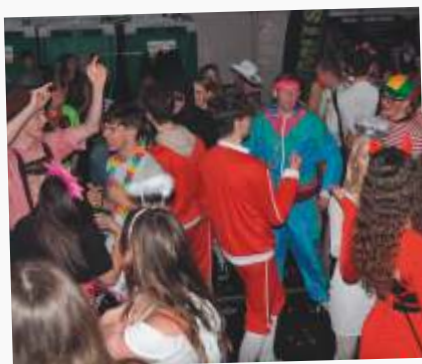
Bijdrage: € 2.000 (per jaar)