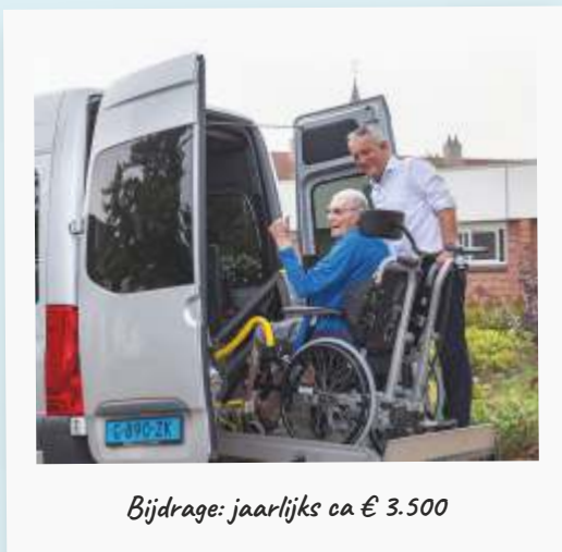
Bijdrage: jaarlijks ca € 3.500

Stichting Samen één Texel heeft door de jaren heen bijgedragen aan diverse maatschappelijke projecten op het gebied van welzijn, gezondheid en huisvesting op Texel. Hieronder een greep uit de projecten die wij hebben gesteund.