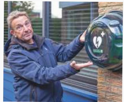
Bijdrage: € 15,000

Om de apparatuur, en de kasten waar de AED's in hangen, up-to-date te houden en de vrijwilligers op te leiden en bij te scholen deed de stichting een beroep op Samen één Texel.